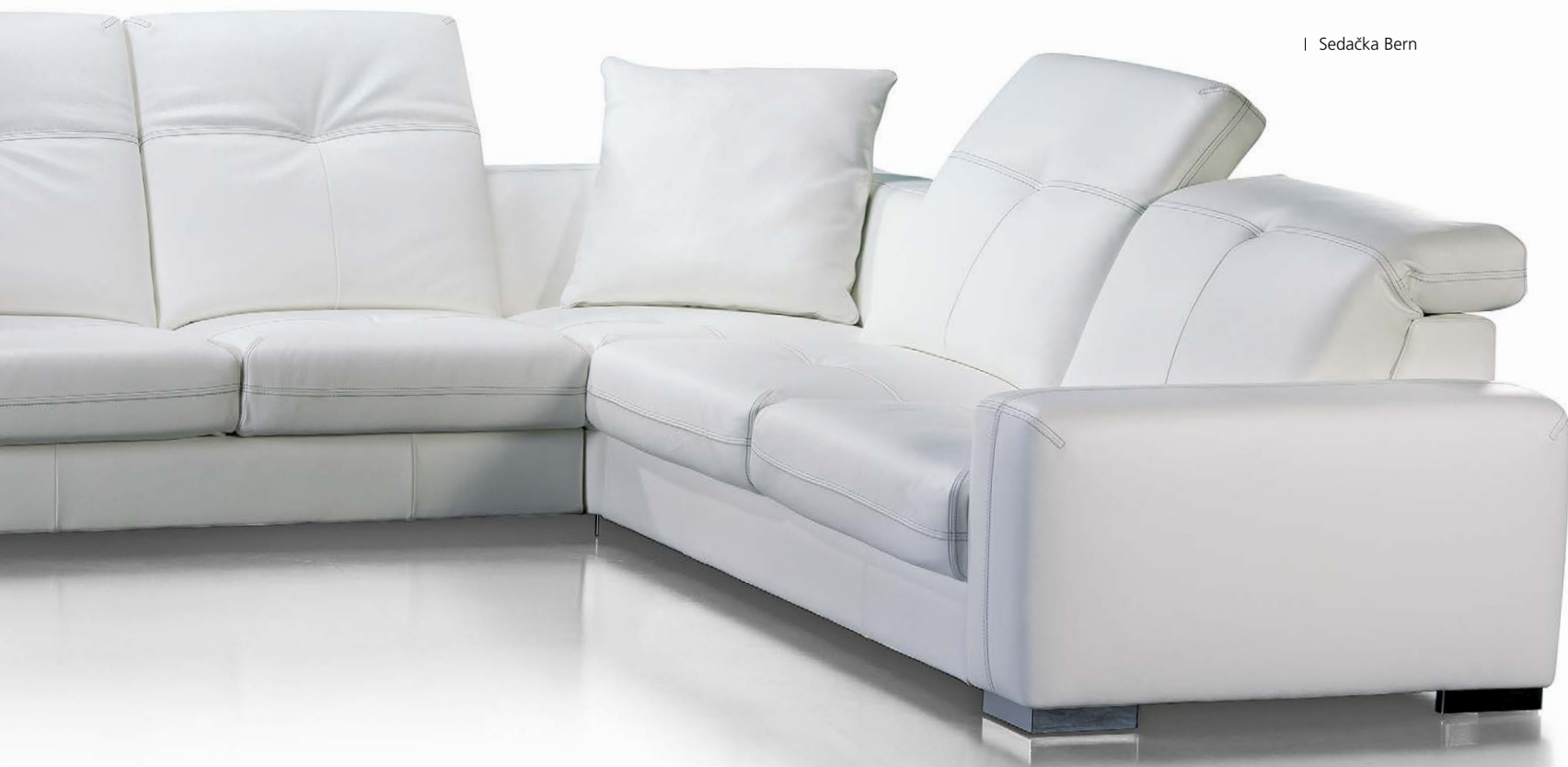
I Sedačka Bern